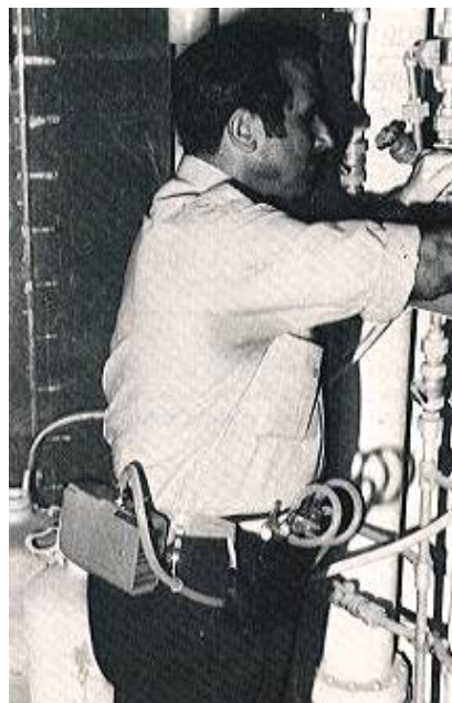
Fig. 4: Toma de muestras con impingers

Colocar el tren de captación en la Parte anterior de la cintura del operario a muestrear (La colocación idónea del tren de captación es a la altura del hombro del operario; sin embargo, sólo es factible en procesos u operaciones que exigen del operario, ligeros o suaves movimientos), fijándola a un cinturón mediante un sistema de sujeción adecuado (pinza, funda o soporte, etc.).