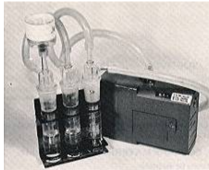
Fig. 3: Equipo de muestreo, con prefiltro

En la captación de algunos contaminantes puede recomendarse la colocación de un prefiltro (montado en un portafiltros o cassette), previo al impinger, con el fin de evitar o eliminar interferencias de partículas ambientales (Ver Fig. 3).