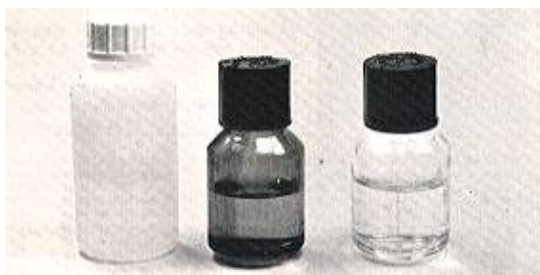
Fig. 5: Frascos para el transporte de muestras y de soluciones absorbentes

Como precaución general las muestras, en cuanto no se analicen, se guardarán en nevera y al abrigo de la luz.